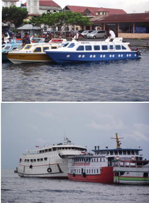
Gambar 3. 1 Alat Transportasi Laut Kapal Penumpang dan Speed Boat

menggunakan speed boat. Selanjutnya dengan kapal laut dari Labuha ibu kota Kabupaten Halmahera Selatan ke Ternate dengan jarak waktu tempuh 8 jam.