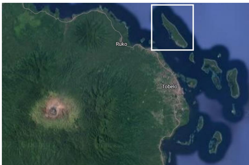
Gambar 1. Lokasi Pulau Tolonuo

memadai, dan peningkatan kesejahteraan guru. Menurut mereka, pendidikan adalah satu-satunya jalan bagi anak-anak mereka untuk memiliki masa depan yang lebih cerah dan keluar dari lingkaran kemiskinan yang telah mengakar.