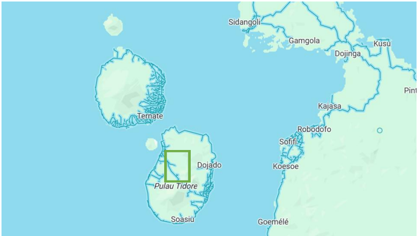
Gambar 3. Lokasi Pulau Maitara