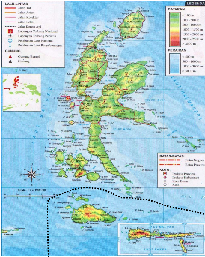
Gambar 2 Peta Provinsi Maluku Utara