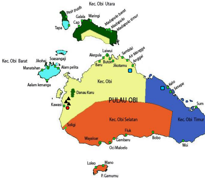
Gambar 4 Peta Penyebaran Perusahaan yang dimiliki Elit yang berkonspirasi