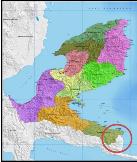
Peta Halmahera Timur berdasarkan peta adat Kesultanan Tidore

ikatan Fagogoru 44 . Fagogoru sendiri sesungguhnya lebih didominasi oleh masyarakat di kawasan Halmahera bagian timur selatan, yang kini dikenal dengan wilayah Halmahera Tengah. Berikut gambaran perbedaan peta dasar masing-masing kabupaten yakni :