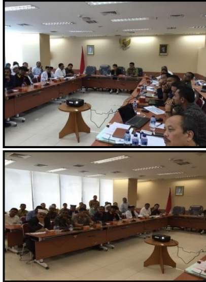
Gambar 7 Undangan Gubernur dan Proses Fasilitasi yang Dilaksanakan Pemerintah Provinsi Maluku Utara