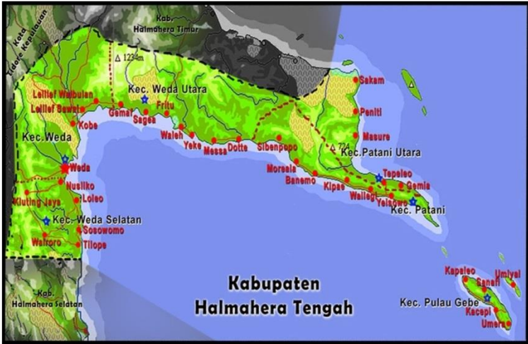
Gambar 3 Peta Wilayah Kabupaten Halmahera Tengah

Luas wilayah Kabupaten Halmahera Tengah tercatat 8.381,48 km 2 yang terdiri dari daratan 2.276,83 km 2 dan lautan 6.104,65 km 2 . Sekitar 73% wilayah Halmahera Tengah merupakan lautan. Sedangkan 27 % lainnya merupakan daratan. Ibukota kabupaten adalah Weda. Secara administratif, kabupaten ini terbagi menjadi 10 Kecamatan. Kecamatan-kecamatan tersebut terdiri dari 61 desa/kelurahan dan 1 UPT. Kabupaten Halmahera Tengah secara geografis berada diantara 0° 45' LU sampai dengan 0° 15' LS dan 127° 45' BT sampai dengan 129° 26' BT. Batas Wilayah Administratif Kabupaten Halmahera Tengah yaitu :