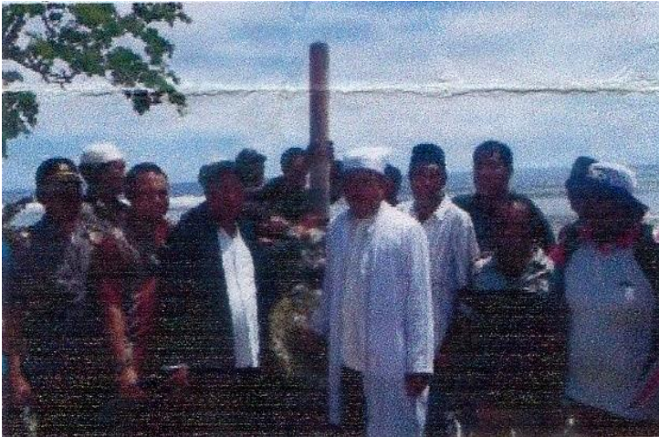
Gambar 5 Penetapan Tapal Batas oleh Sultan Tidore di Sakakube