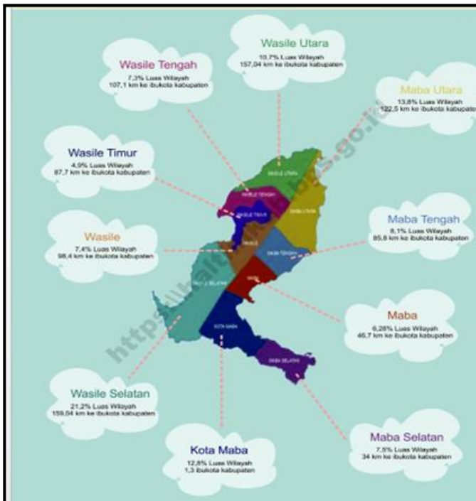
Gambar 2 Peta Sebaran Kecamatan dalam Wilayah Kabupaten Halmahera Timur

Sebaran wilayah 10 (sepuluh) kecamatan dalam Kabupaten Halmahera Timur dapat dilihat pada gambar berikut :