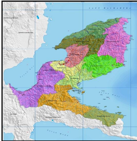
Gambar 1 Peta Wilayah Kabupaten Halmahera Timur

Kabupaten Halmahera Timur merupakan dataran rendah dengan ketinggian rata-rata 0-5 meter diatas permukaan laut, terletak pada posisi 0 o 40'-01 o 4' Lintang Utara dan 126 o 45'-129 o 30' bujur timur. Luas wilayah Kabupaten Halmahera Timur, adalah berupa daratan seluas 6.506,30 km 2 , lebih jelas dapat dilihat pada peta berikut :