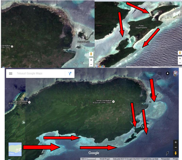
Gambar 3 Peta Lokasi Kawasan Pengembangan Budidaya Rumput Laut Desa Mano Kec. Obi Selatan